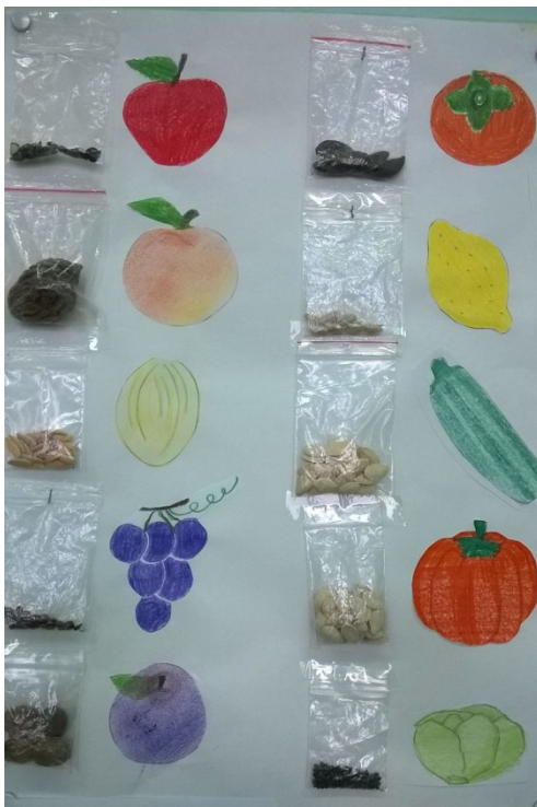
Rappresentazione grafica di frutti con relativi semi.